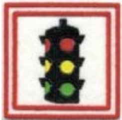
Amico del quartiere