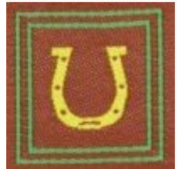
Amico degli animali