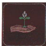
Amico della natura