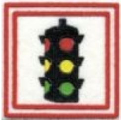
Amico del quartiere