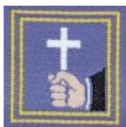
Servizio della Parola