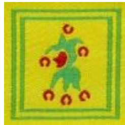
Maestro dei giochi