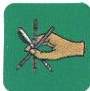
Animazione grafica o giornalistica