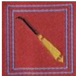
Lavoratore in cuoio